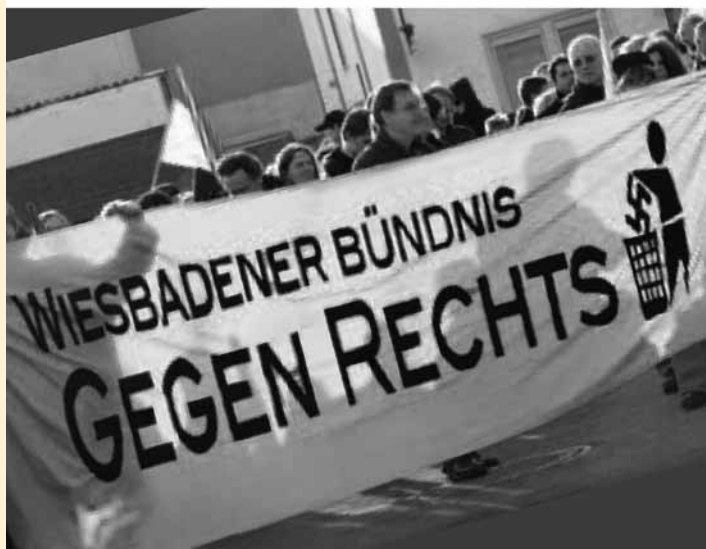
Wiesbadener Bündnis gegen Rechts - Römerberg 9 · 65183 Wiesbaden Mobil 0176-21231712 · kontakt@wiesbadengegenrechts.de

zum „aktivsten hessischen Kreisverband“ zu werden und durch monatliches öffentliches Auftreten eine Gewöhnung bei der Wiesbadener Bevölkerung zu erreichen.